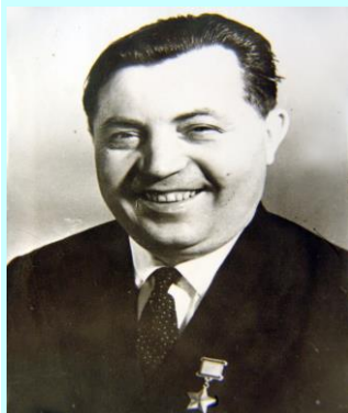
ПАВЛОВ Яков Федотович